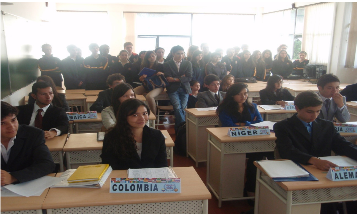
Foto: HISPAMUN en el CCEE Reyes Católicos de Bogotá

En coherencia con el valor asumido de la igualdad de género, esta programación estará redactada en género neutro, y además, será un hecho trabajado en los diferentes cursos, así como, los contenidos referidos al cambio climático. El departamento de filosofía, para reducir el impacto sobre el medio ambiente, realiza todo el proceso de enseñanza-aprendizaje mediante las TIC's, y así, no se utiliza papel, en los trabajos del alumnado, como tampoco en la recogida de información para la evaluación.